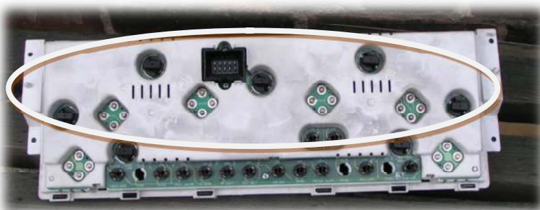
żarówki oświetlające „zegary”