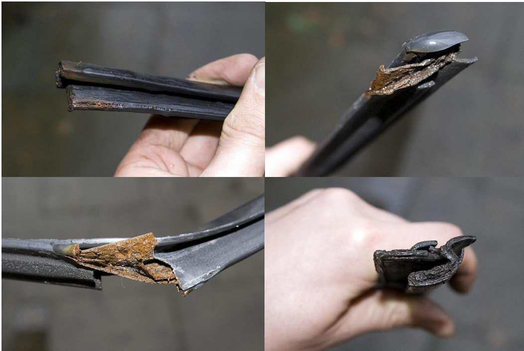
4. Co zastajemy pod spodem