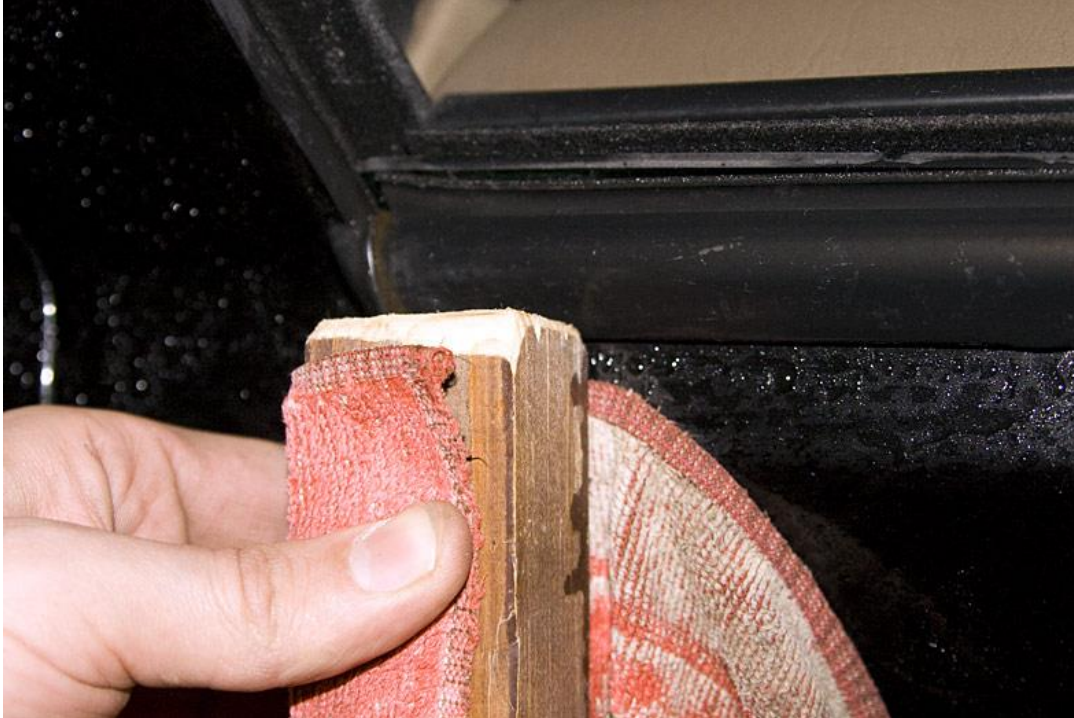
3. Tak wyglądają uszczelki po zdjęciu